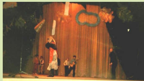
28 декабря 1995 г. На сцене ДК "Машинно-строитель" - спектакль "Вверх по дымоходу".

Так началась моя "карьеря" в театре и продолжалась до 1999 года включительно. Году в 1998-м я ушел из "Монтеса" и вернулся лишь однажды, чтобы сыграть в 1999-м в очередном спектакле "Сыр-бор". Помню, после просмотра я не мог уйти из зала, не пообщавшись с друзьями. Общение с ними способствовало моему возвращению в "Монтес", хотя и недолговременному: времени на театр в ту пору просто уже не оставалось. А я привык относиться к делу ответственно, и разрываться между школой и, как бы я