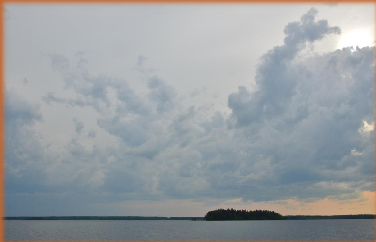
Июнь 2020

Июнь. 1. +20-25, солнце, небо чистое. 6. День солнечный, но холодный ветер. 9. Утром тучи, потом до конца дня солнце и очень тепло. 15. Очень сухо сегодня и в эти дни. 17. День теплый, ветер. 19. До обеда тепло, но сильный ветер. Около 16 ч. небольшой дождь, к 16:40 перестал. 21. Днем без дождя, около 19:30 морозящий дождь. 22. +10, холодно, ветер, ночью был дождь и утром.