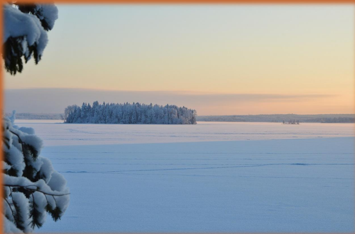
9 января 2021