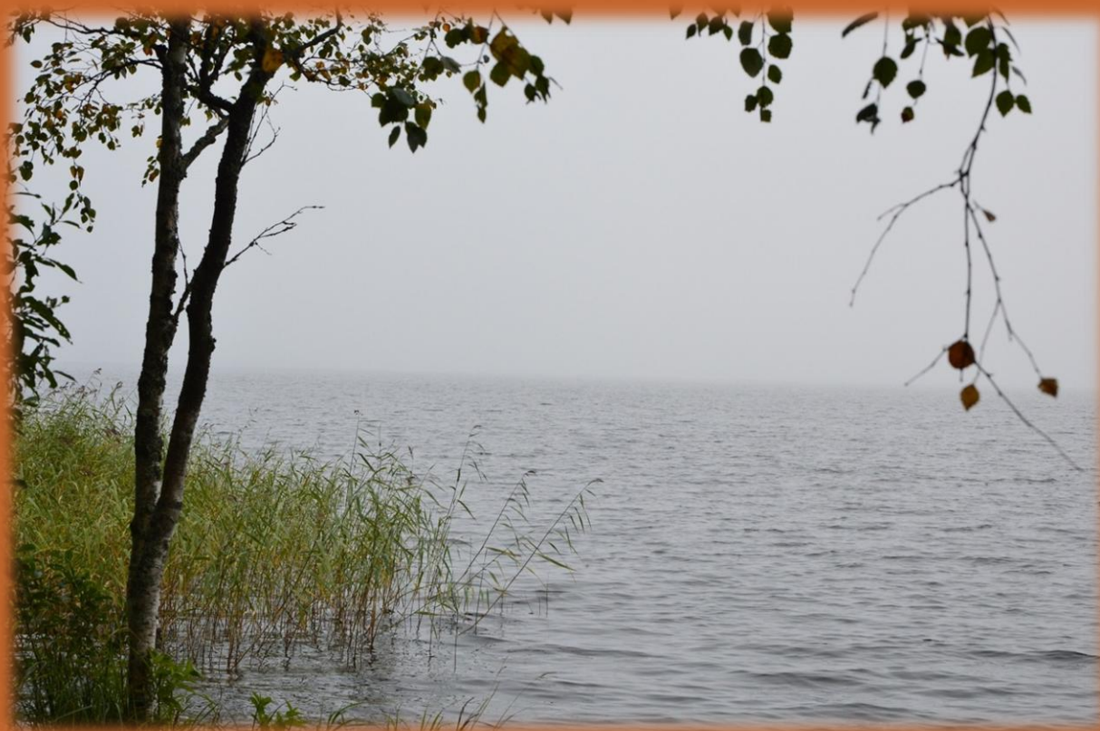
5 сентября 2020, фото Д. Нечаева

небо чистое, чуть прохладно; в обед солнце, тепло. 5. Около 9:30 пасмурно, проглядывало солнце, прохладно; вечером пасмурно и прохладно. 6. В 6 утра прохладно и пасмурно. 13. Около 18 ч. холодно и пасмурно, около 21 ч. кратковременный сильный дождь. 14. Утро холодное и хмурое, ночью был дождь; около 11 утра сильный дождь, оставшийся день после обеда пасмурно, временами дождь. 15. В начале 9-го утра пасмурно, холодно, моросил дождь и в 12 часов тоже. 20. В 12:30 моросило, холодно; ночью было около нуля, днем тепло; в 18:30 кратковременный град. 21. Ночью был мороз, на земле иней и корка мерзлоты. 27. В 12:30 дождик, как и весь день, но тепло. 28. Утро пасмурное, весь день моросил дождь, потом сильный к вечеру.