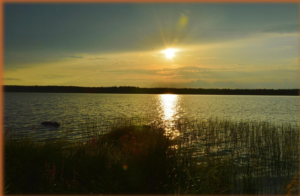
9 августа 2020

наблюдался с севера на юг большой метеор с ярким хвостом. 15. Утром пасмурно, ветер на озере, прохладно; вечером волны. 16. Утром пасмурно, тучи, чуть прохладно; днем крупный дождь и перестал около 14 ч. После обеда и до вечера солнечно и тепло. 19. Ночью был дождь. 20. В начале 3-го солнечно, ветер, около +21; около 18 ч. минутный дождь и до вечера потом ходили тучи, но дождя уже не было. 21. День пасмурный, прохладный, слабый ветер, волны. В начале 12-го ночи сильный ветер. 22. Утром пасмурно и холодно; вторая половина дня – тепло и солнечно. 23. Рано утром прохладно, туман. 25. Утро солнечное, но прохладно. 27. В начале первого дня тепло и солнечно; вечером тепло и солнечно (около +21). В начале 10-го вечера сильный дождь, ветер, на озере волны. 28. Около 8:30 утра пасмурно, тихо, без ветра, прохладно. В 12 ч. тихо, пасмурно, тепло; в обед солнечно и тепло; около 19 ч. на озере волны и вечером пасмурно, без ветра. 29. Около 9 утра сквозь пелену пробивалось солнце, чуть прохладно; в обед краткий дождь; в 13:10 солнце и тучи, вечером солнце, тепло. 30. Около 6 утра около +6, над озером дымка.