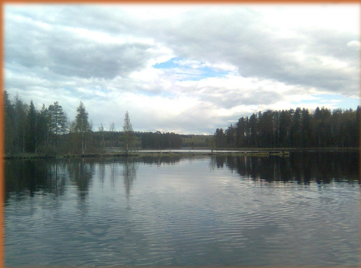
Май 2020

Май. 10. В начале 11-го холодный ветер, временами солнце, облака, льда нет. 25. Утром холодно и пасмурно. 29. День теплый, тихий, без дождя, солнце.