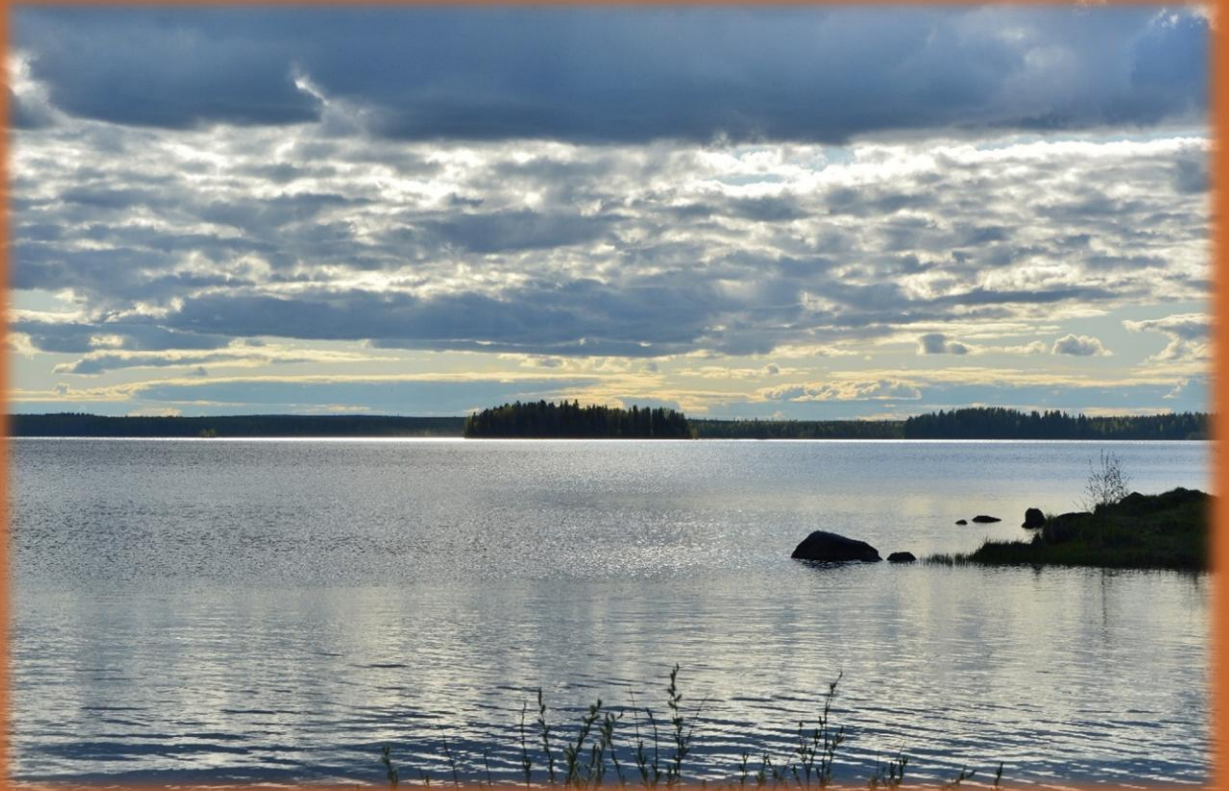
Машезерка, конец мая 2020