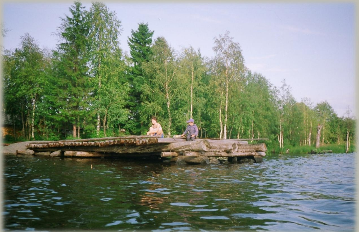
Май 1991. Старый пирс, разрушенный льдом весной в начале 2000-х гг.