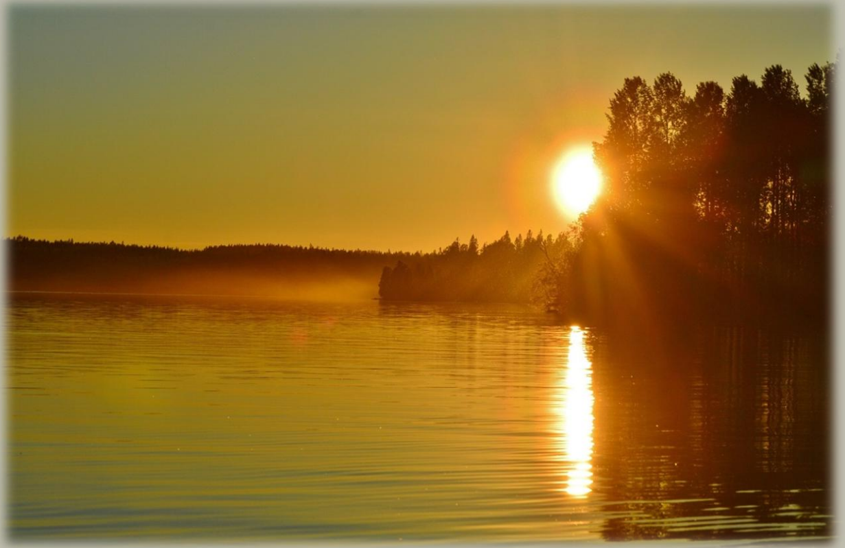
Закат 3 июня 2021