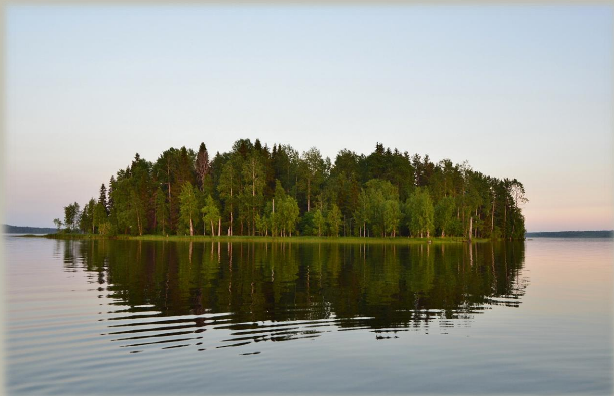
О-в Ильинский с северной части