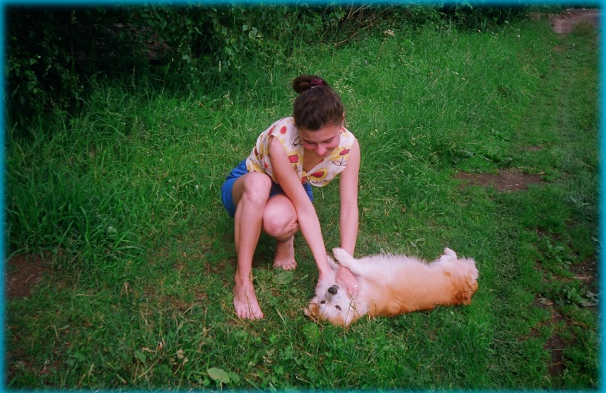
Местный собач Кузя