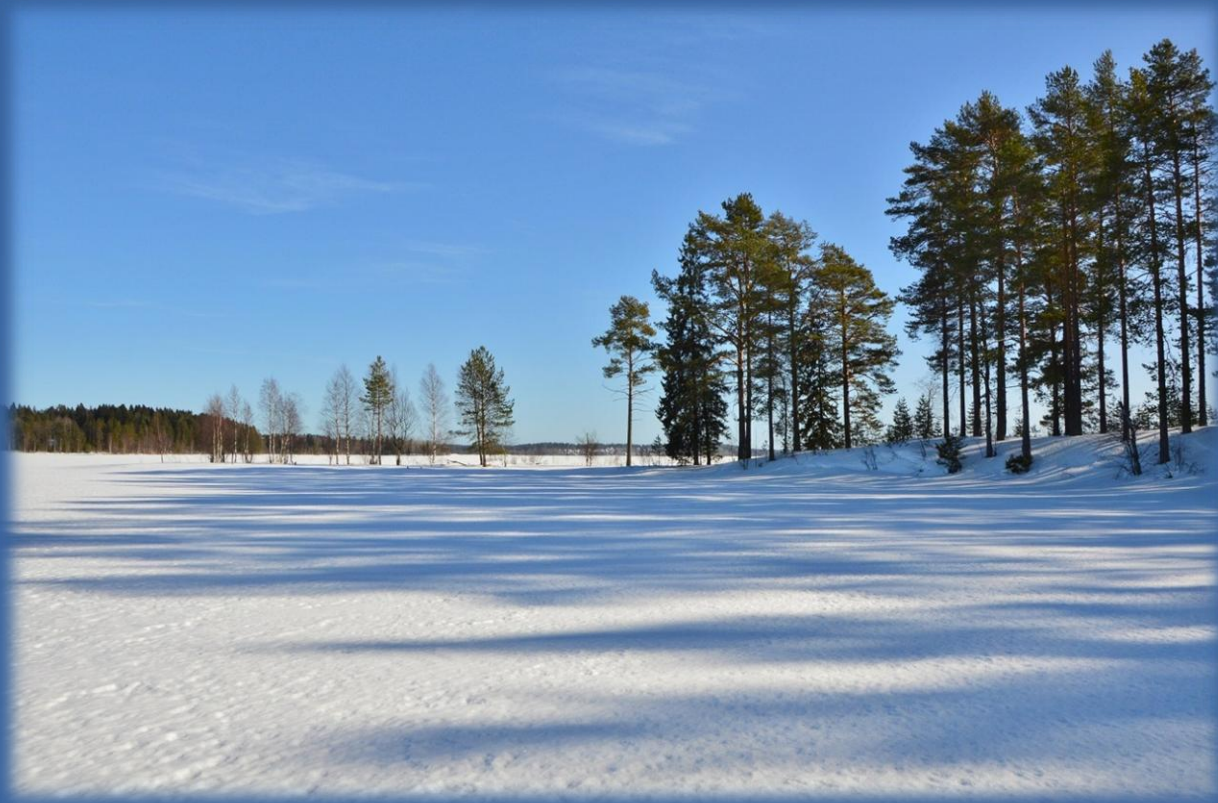
Сосны на озере