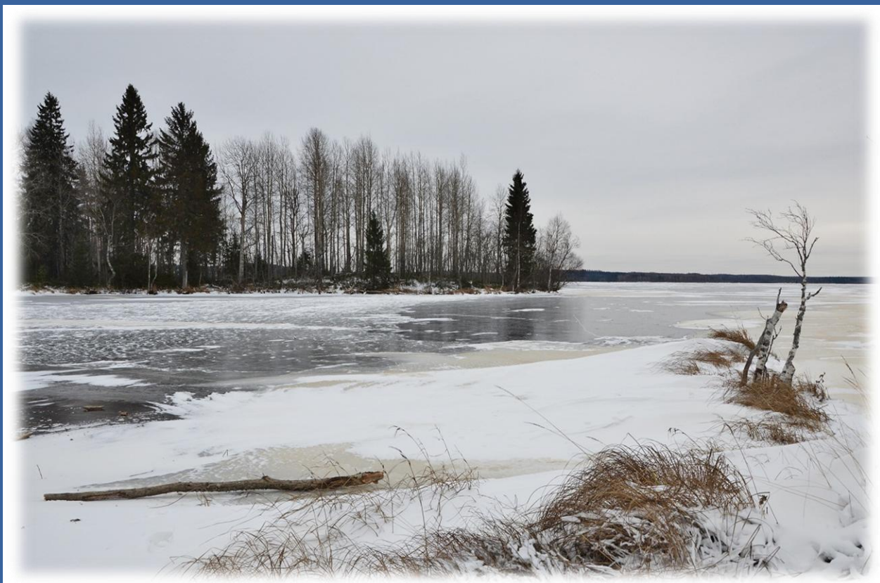
28 декабря 2018 г.