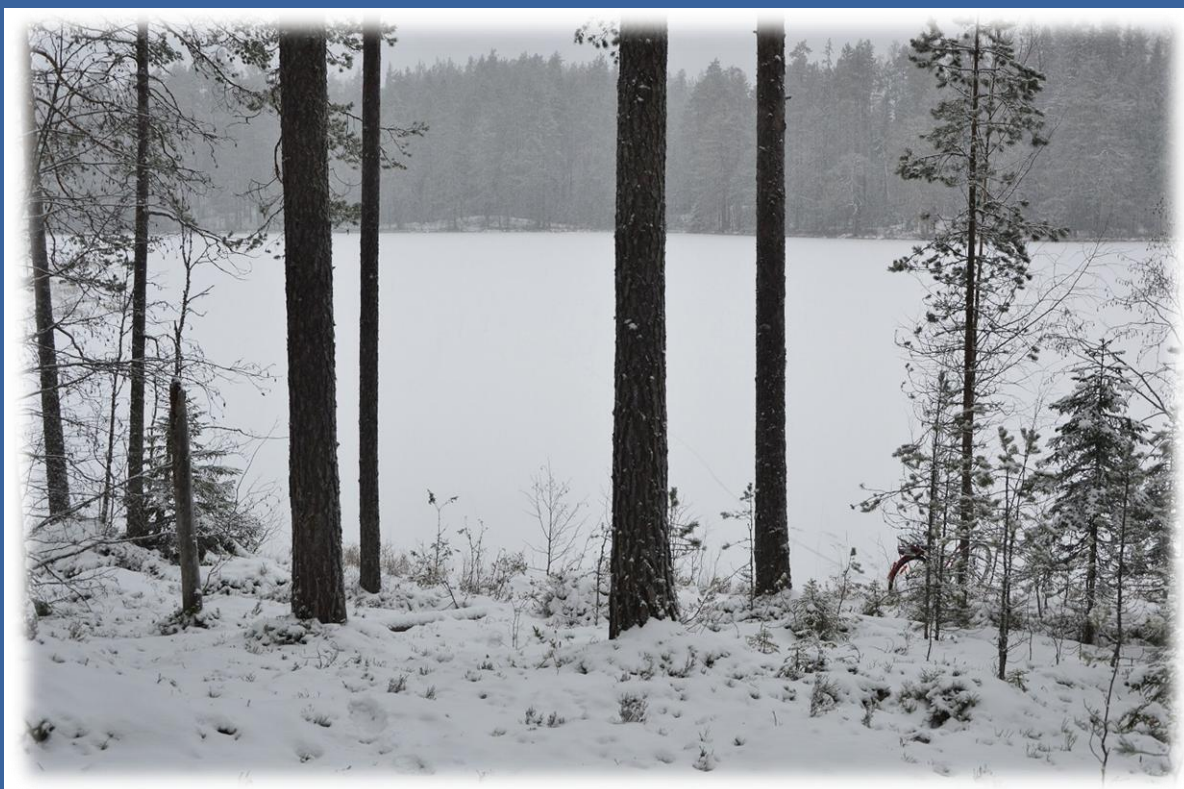
Ламба на Гурвиче в 2020 г.