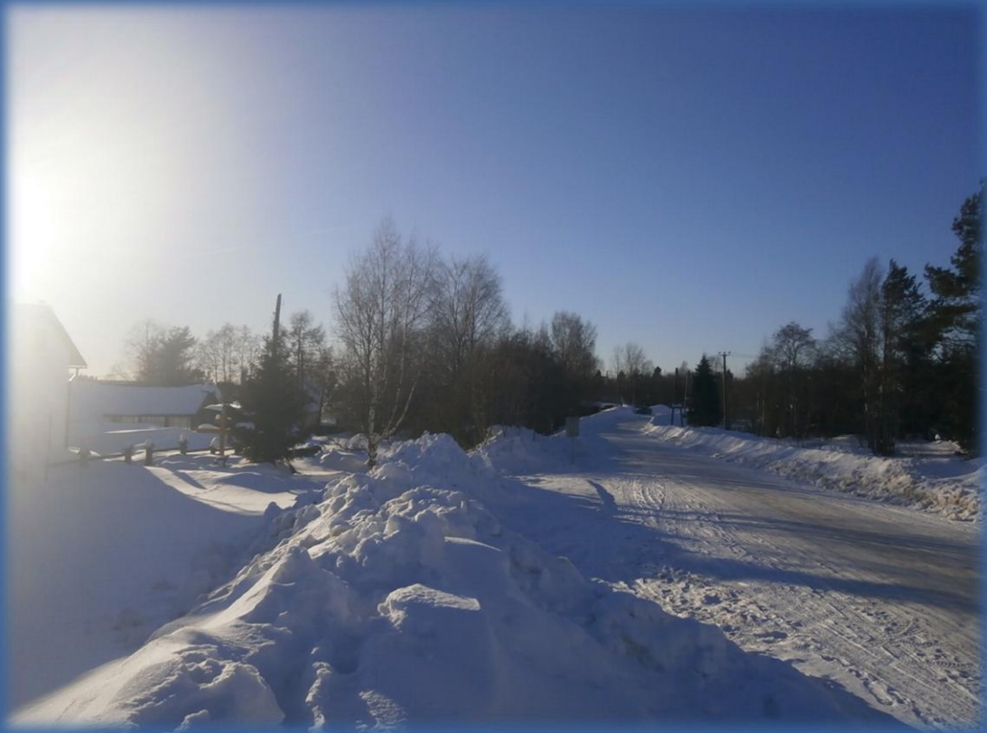
Ниже – фото Д.Нечаева